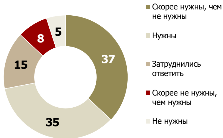
Необходимость праздников, %

72% жителей считают, что праздники необходимы, 13%, что не нужны.