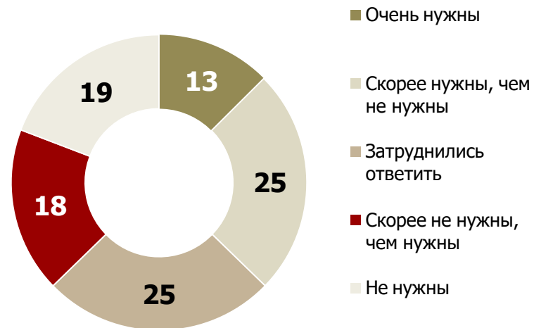
Необходимость праздников, %